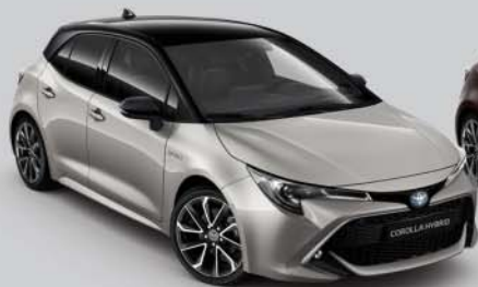
2RD Precious Silver s /Night Sky Black s