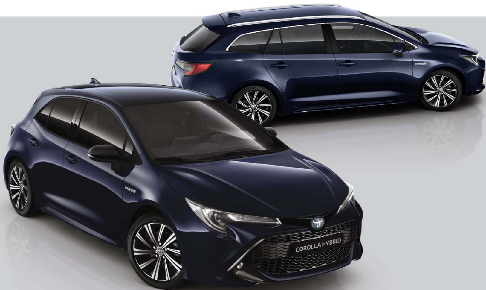
Modele illustre : Corolla Hybrid Style.