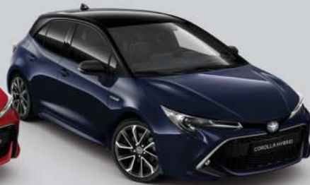
2UQ Midnight Blue/Night Sky Black