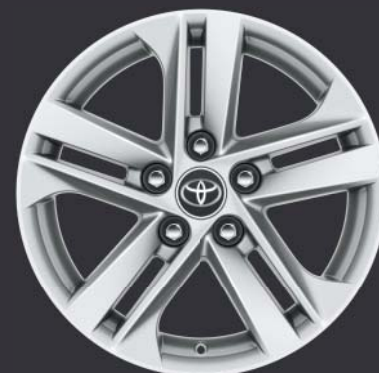
Jantes de 16" en alliage (5 doubles branches) De série sur Dynamic