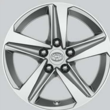
Jantes de 16" en alliage, couleur argent (5 branches) En option sur toutes les exécutions