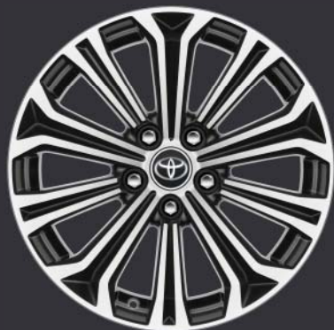
Jantes de 17" en alliage brossé, coloris noir (10 branches) De série sur Premium TS 1.8 l