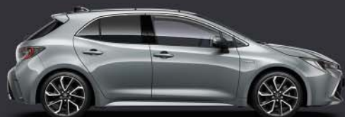
1H5 Cement Grey §