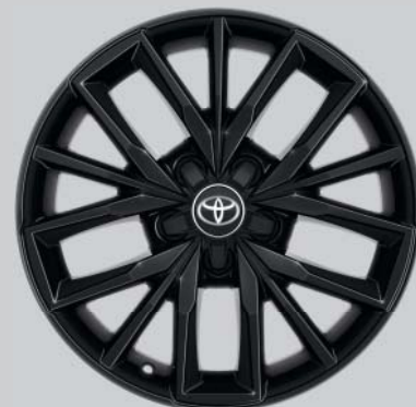
Jantes de 17" en alliage, couleur noir (5 triples branches) En option sur toutes les exécutions