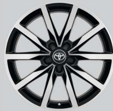
Jantes de 18" en alliage brossé, couleur noir (5 doubles branches) En option sur toutes les exécutions