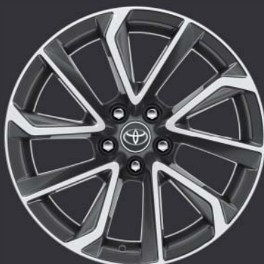
Jantes de 18" en alliage brossé, coloris gris bi-ton (5 doubles branches) De série sur Premium