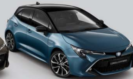
2RG Denim Blue/Night Sky Black