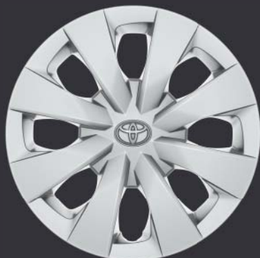
Jantes de 15" en acier avec enjoliveurs (8 branches) De série sur Corolla