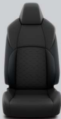
Habillage en tissu à motifs en relief, noir avec surpiqûres grises De série sur Dynamic Plus