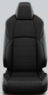
Habillage partiellement en cuir, noir avec surpiqûres noires De série sur Style