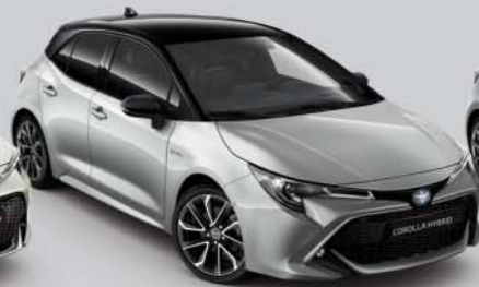
2KS Ultra Silver/Night Sky Black