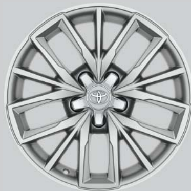
Jantes de 17" en alliage, couleur argent (5 triples branches) En option sur toutes les exécutions