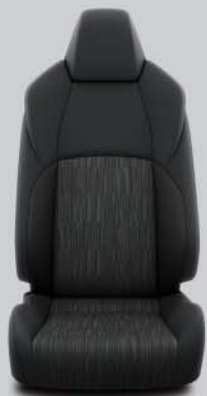
Habillage en tissu, noir De série sur Corolla