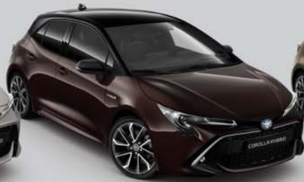
2RE Mocha Brown/Night Sky Black