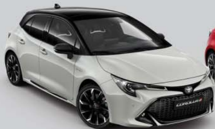
2RZ Dynamic Grey s /Night Sky Black s