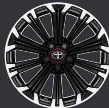
Jantes de 17" en alliage brossé (10 branches) De série sur GR SPORT