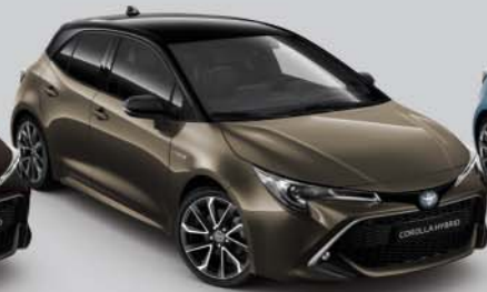
2RF Oxide Bronze s /Night Sky Black s