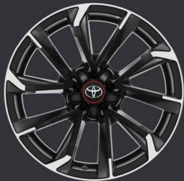
Jantes de 18" en alliage brossé bi-ton (5 doubles branches) De série sur GR SPORT+