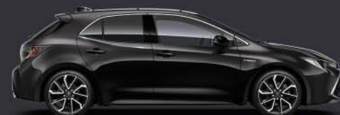
209 Night Sky Black §