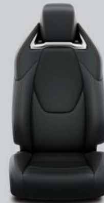
Habillage GR SPORT+ en cuir De série sur GR SPORT+