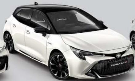
2NR Pure White/Night Sky Black