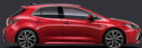
3U5 Emotional Red §