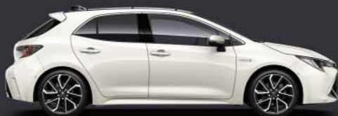
070 White Pearl*