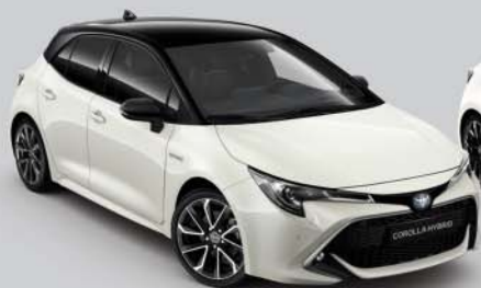
2KR White Pearl s /Night Sky Black s