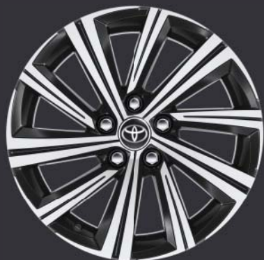
Jantes en alliage de 17" à face usinée (à 10 branches) De série sur Style