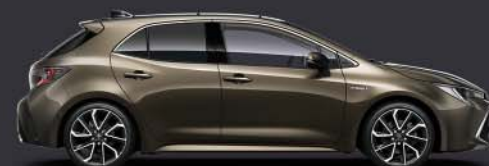
6X1 Oxyde Bronze §