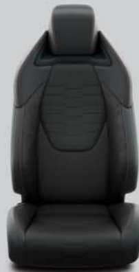
Habillage partiellement en cuir, noir avec surpiqûres rouges et inserts noirs De série sur Premium Plus