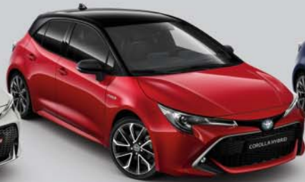
2SZ Emotional Red s /Night Sky Black s