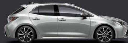
1F7 Ultra Silver §