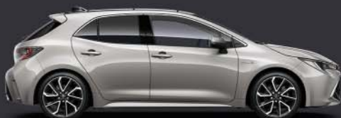
1J6 Precious Silver §