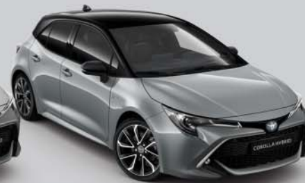
2QS Manhattan Grey/Night Sky Black