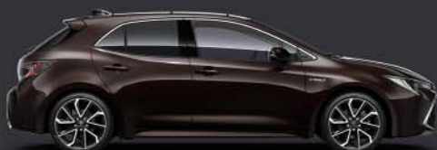
4W9 Phantom Brown §