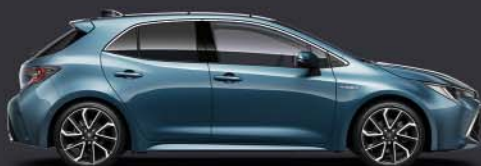
8U6 Denim Blue §