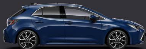
8Q4 Dark Blue