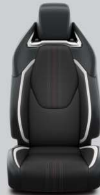
Habillage GR SPORT en tissu/cuir De série sur GR SPORT