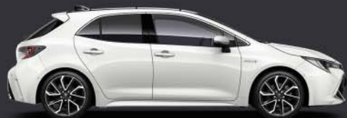
040 Super White